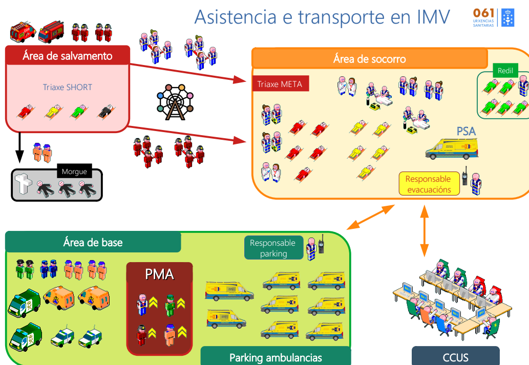
Imaxe 1. Esquema de sectorización en IMV

Parking de ambulancias: dirixido polo responsable de Parking, que garantirá que non obstaculicen a chegada doutros vehículos.